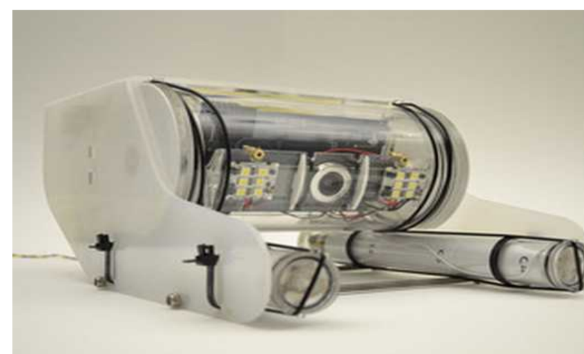
OpenRov : un robot libre pour explorer les fonds marins