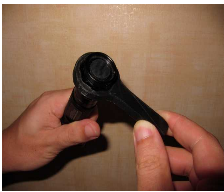
Une clé sur mesure.