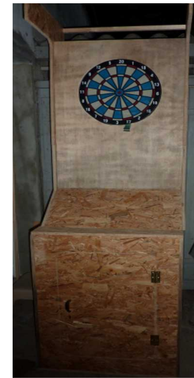
Un jeu de fléchette électronique maison Les règles sont programmables. c'est le développeur qui gagne 😊